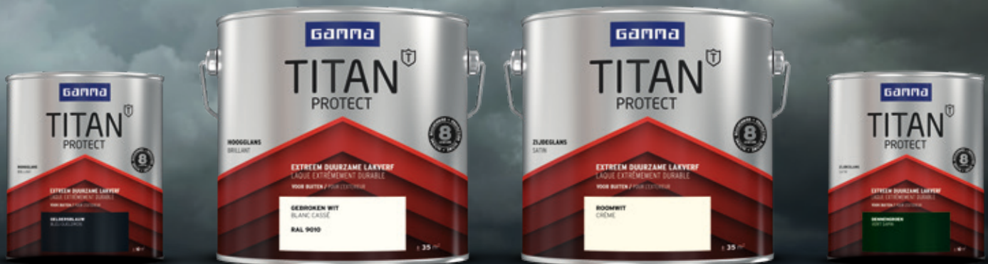
BUITENLAK HOOGGLANS 0,75L

We brengen je een palet van 12 standaardkleuren. En we kunnen GAMMA TITAN Protect mengen in iedere kleur die je maar wilt. Dat is wel zo prettig. Nu kan iedereen schilderen als een professional.