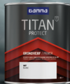
GRONDVERF 2,5L/0,75L LICHTER ONDERGROND