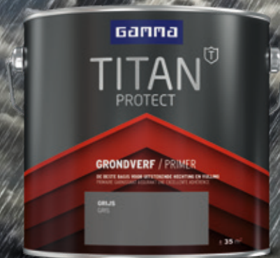
GRONDVERF 2,5L/0,75L DONKERE ONDERGROND