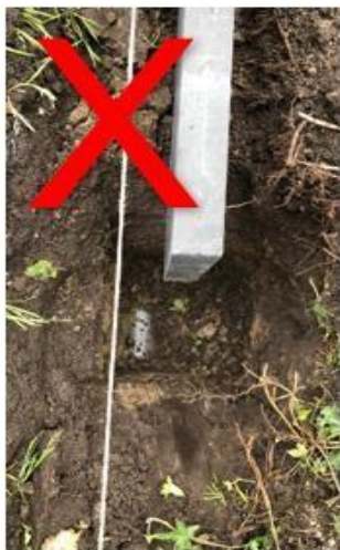
Rioleringen dienen verwijderd te zijn