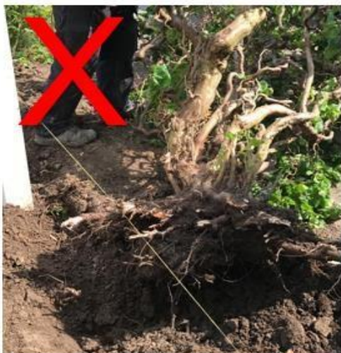
Boomstronken dient u vooraf te verwijderen

De grondwaterstand mag niet te hoog staan.