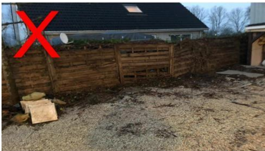
Oude erfafscheidingen dienen verwijderd te zijn