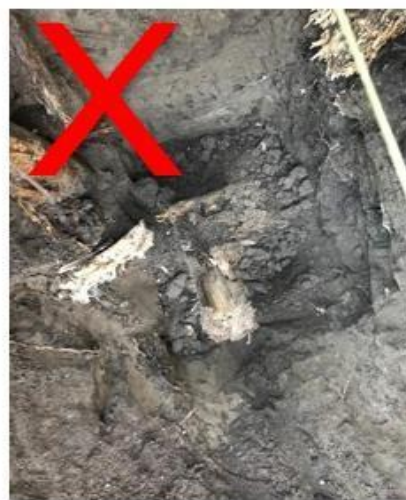
Wortels en boomstronken dienen weg te zijn